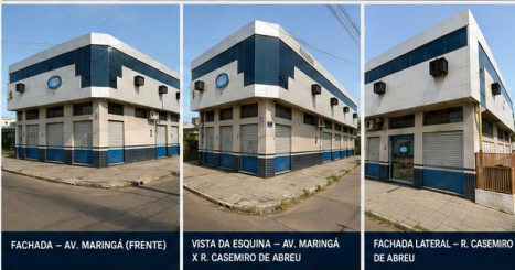
FACHADA – AV. MARINGÁ (FRENTE)