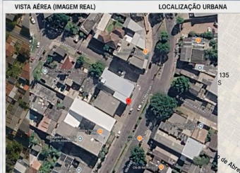
VISTA AÉREA (MAGEM REAL)