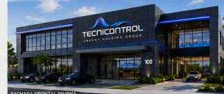
FACHADA FRONTAL DIURNA